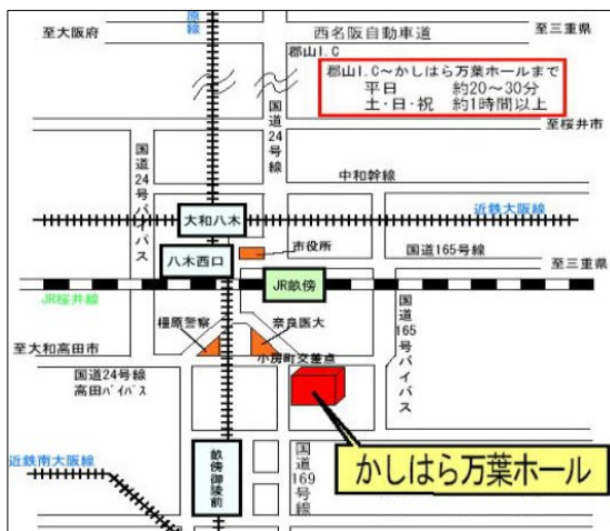
かしはら万葉ホール

[第3・4講座] 2019年7月25日(木) 12:30 受付 13:00 開会 やまと郡山城ホール 大和郡山市北郡山町211-3 TEL0743-54-8000 ※駐車場の確保はできません。公共交通機関等をご利用ください。