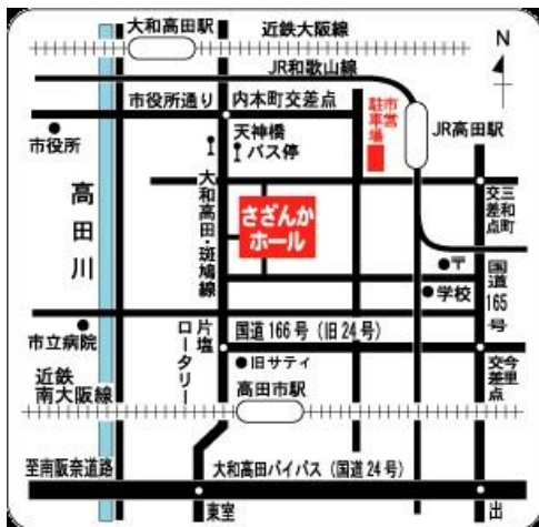
大和高田さざんかホール

JR高田駅より南西へ400m 近鉄大和高田駅より南へ750m 近鉄高田市駅より北へ1km